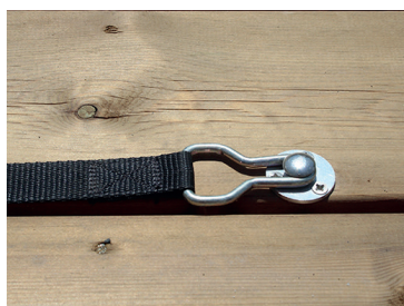
Sangle avec boucle