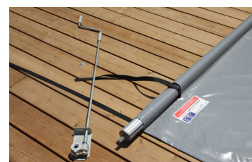
Manivelle manuelle démultipliée