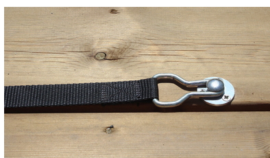
Sangle avec boucle