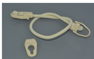
Sandow V avec plaquette (selon forme de la bâche)